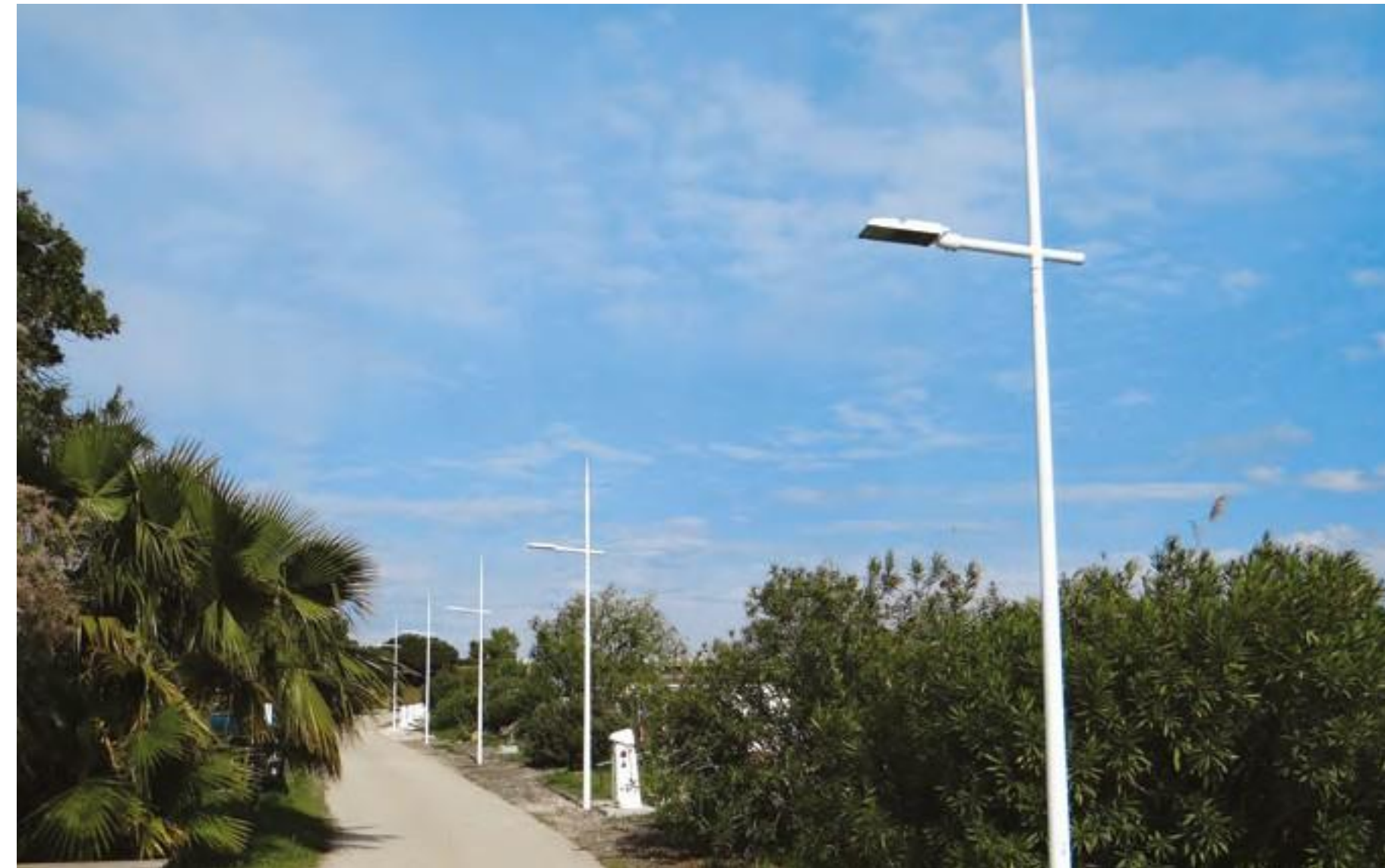
Port de GALLUCIAN (30)