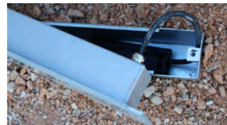
Optique scellée IP68 et boîte de raccordement dans le pot