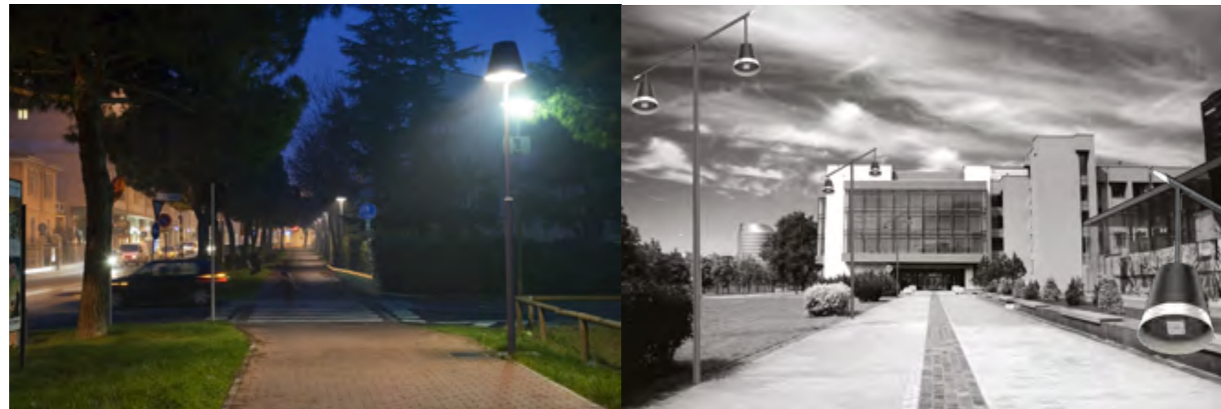
CAMELO suspendu, ensemble mât et crose