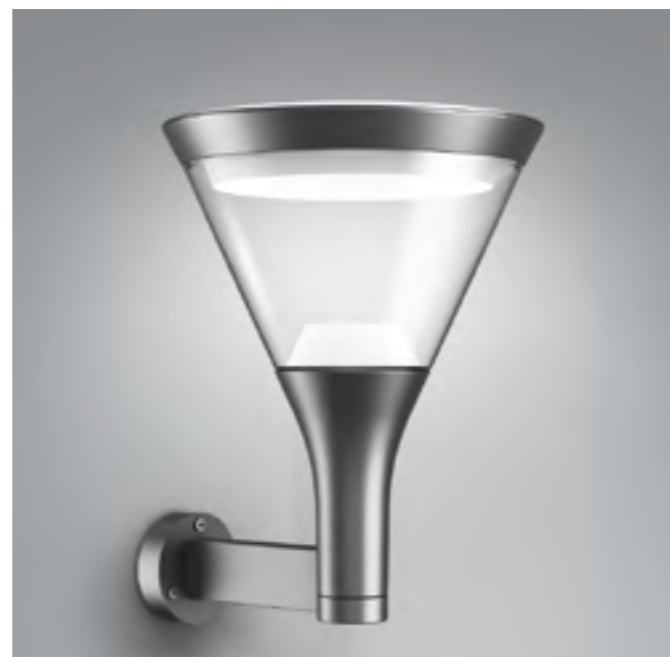
SKY PARK avec fixation murale