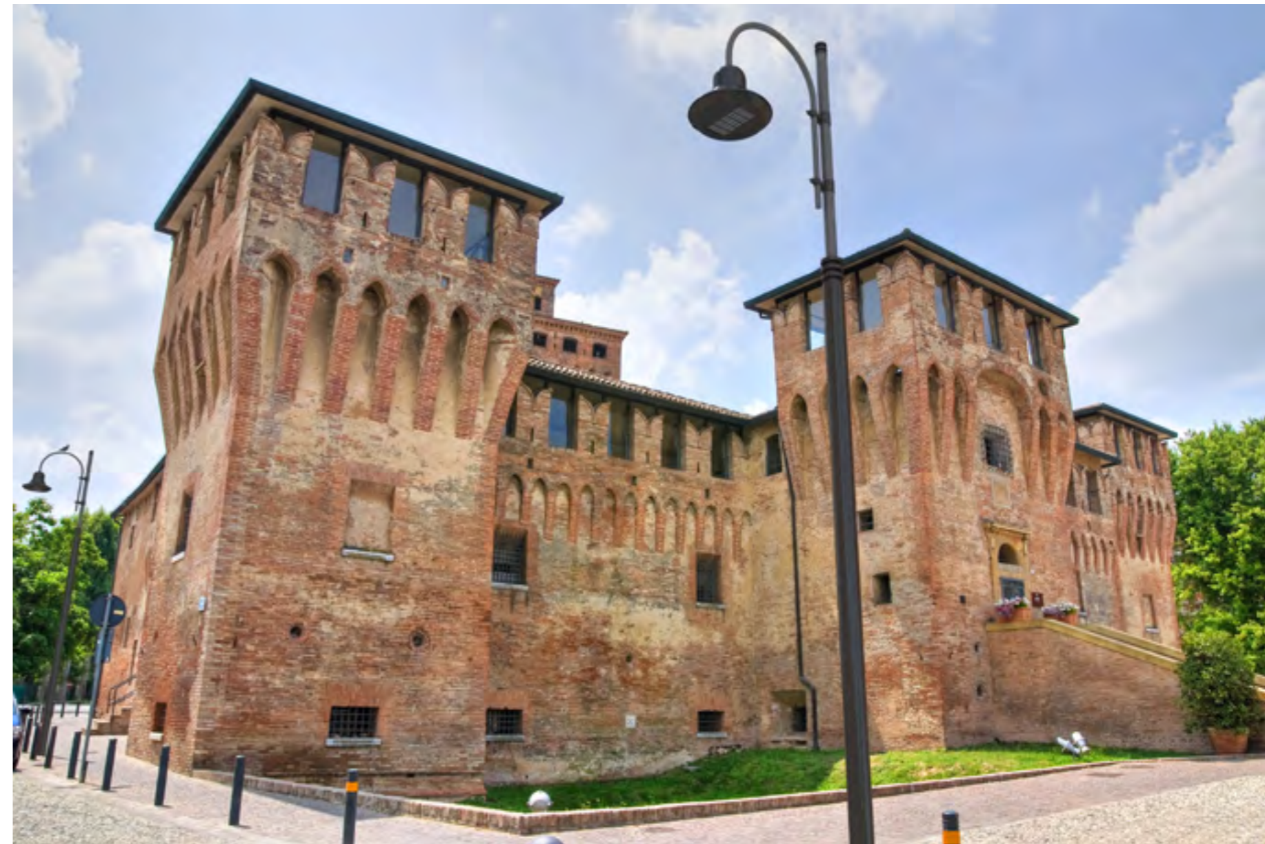
Ensemble PCD 2